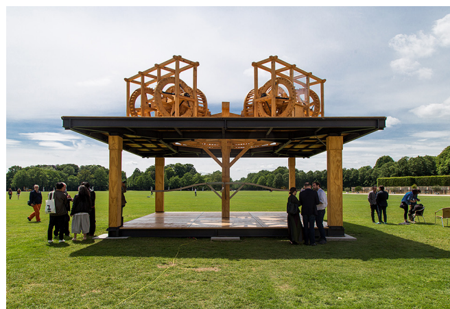
El molino de la sangre-2017. Antonio Vega Macotela documenta 14 Kassel, Karlsruhe Hesse. Alemania.

Sin embargo, no se tenía en cuenta que, salvo excepciones específicas en países litorales sudamericanos como Argentina y Uruguay, las clases populares ni leían, ni escribían y fue el acceso a las industrias culturales el primer indicio de acceso a los valores dinámicos, de algún modo más integradores del proceso de modernización del campo social y cultural en América Latina. (Barbero 1991)