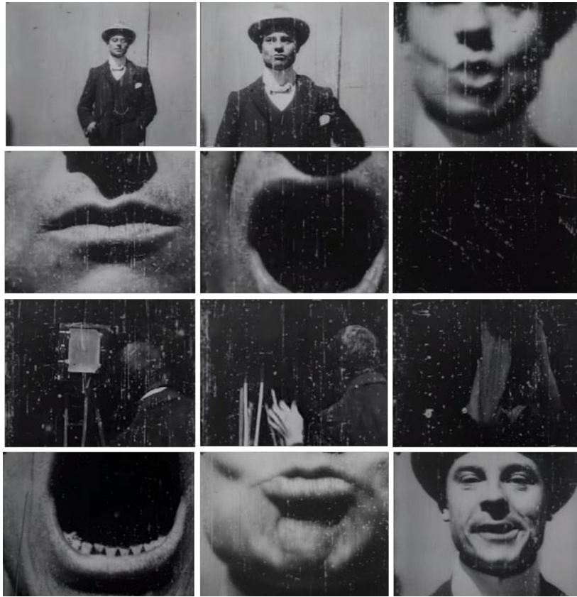
Fig. 3. The big swallow (James Williamson, 1901)