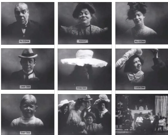
Fig. 5. The Whole Dam Family and the Dam Dog (Edwin S. Porter, 1905)

The Whole Dam Family and the Dam Dog (Edwin S. Porter, 1905) presenta con una serie de primeros planos, a los siete miembros de la familia Dam, con claras reminiscencias hacia el mundo del comic al que hacía referencia Gunning. Una vez concluida esta parte de presentación, y tras unos créditos que señalan “la familia Dam al completo” seguidos de un plano de conjunto a modo de retrato familiar, comienza la acción en el habitual plano general [fig.5] respondiendo a todas las directrices del MRP en cuanto a construcción espacial.