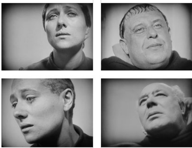
Fig.7. La Pasión de Juana de Arco ( La Passion de Jeanne d'Arc , Dreyer, 1928)

No encontraremos aquí una acción desarrollada a partir de planos de conjunto que se aproximen al actor en momentos clave. Encontramos, sin embargo, una narración que es sostenida casi en su totalidad a partir de primeros planos que alternan el rostro de Juana de Arco con el de sus jueces [fig. 7]. De esta forma, el filme se convierte en un ejemplo diametralmente opuesto a lo habitual en los primeros años del cine, donde el plano general era utilizado durante toda la filmación a excepción de los escasos primeros planos que ocupaban la pantalla en contadas ocasiones.