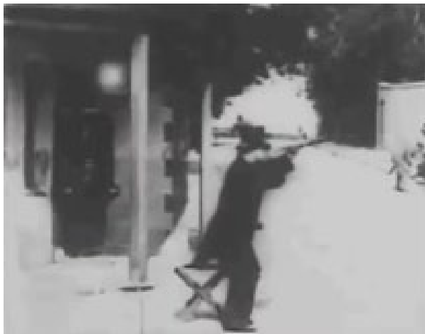
Fig.2. As seen through a telescope (George A. Smith, 1900)

Otro ejemplo temprano, pero radicalmente distinto, aparece en The big swallow (James Williamson, 1901) donde el uso del primer plano –que en este caso llega a convertirse finalmente en un plano de