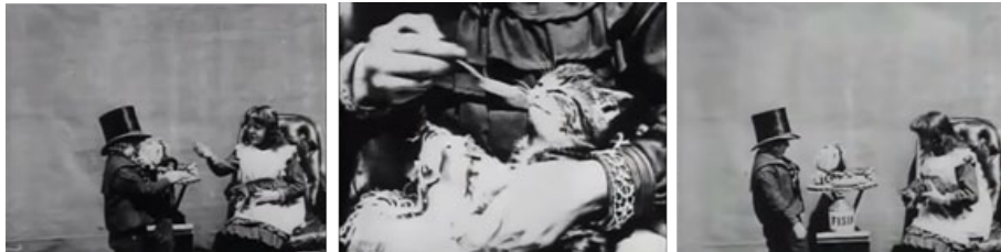
Fig.4. The sick kitten (George A. Smith, 1903)

lle, como si nosotros mismos nos levantásemos de nuestra butaca para observar con atención, Grand-ma's Reading glass nos pone directamente en el lugar del personaje, viendo exactamente lo mismo que él ve a través de la lupa en una rudimentaria cámara subjetiva. Además, para enfatizar todavía más esa sensación de "mirar a través" los primeros planos de ésta última se encuentran enmarcados dentro de un círculo que imita la forma de la lente eliminando así el resto del entorno mediante un fundido negro. No vemos ya a través de los ojos del personaje, sino que vemos sólo a través de la propia lupa. Nos encontramos, por tanto, ante dos ejemplos donde el uso del primer plano es totalmente distinto, enfrentando la fragmentación espacial a la cámara subjetiva.