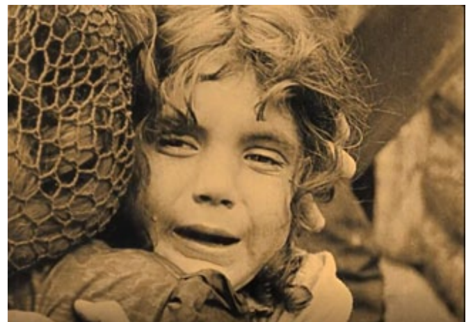
Fig.6. El nacimiento de una nación ( The birth of a Nation , G.W. Griffith, 1915)

El descubrimiento más importante de Griffith descansa, pues, sobre esta idea de que el orden de planos en la secuencia venga dado por las exigencias dramáticas (...) la [cámara] de Griffith entraba a formar parte de la acción de un modo decidido y positivo. La división de un hecho en pequeños fragmentos para mostrar cada uno según la posición de